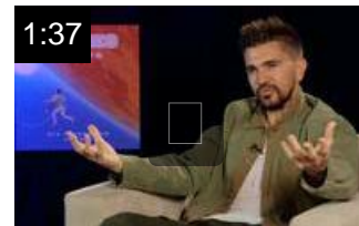
Juanes rompe el molde con su nuevo disco "Mis planes son amarte"